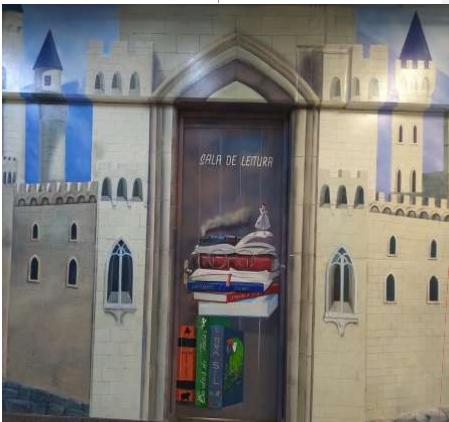
PORTA DA SALA DE LEITURA DA EMEF PROFESSOR DR. VALTER PAULINO ESTEVAM