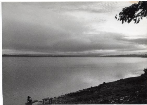
Figura 14 – Rio Araguaia

- 1975, Xambioá, às margens do Araguaia, no então Estado de Goiás. Chegamos lá poucos meses após o exército brasileiro ter dado como encerrada a Guerrilha do Araguaia.