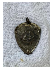
Figura 15 – 1ª medalha

Comecei no esporte antes mesmo de entrar para a escola. Tenho, ainda, comigo minha primeira medalha no Judô, que ganhei em 1960, logo depois da inauguração de um clube que meu pai, um autodidata da Arquitetura, projetou.