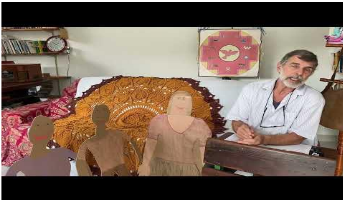
Figura 13 – Vídeo “Diálogos Interiores”

- Escreve! - Mas escrever o quê? - Qualquer coisa, apenas escreve! - Mas, e as vírgulas? - Ora as vírgulas, quem liga pra elas? Depois você as joga em qualquer lugar. - Não sei não ... isso pode dar ruim ... Não é tão fácil assim; pelo contrário, escrever é difícil.