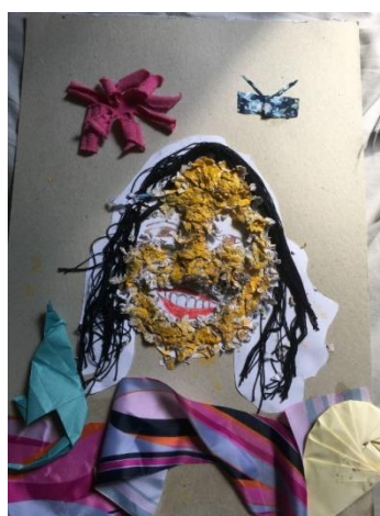
Figura 9 - Bandeira de Luísa

Na sequência das bandeiras, produzimos as biofantasias (vídeos), que foram postada no painel do Curso.