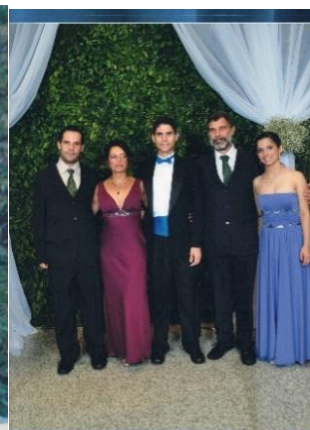
Figura 24 - Família

- Certo, mas chega de blá-blá-blá; e vamos ao que interessa: o que você vai fazer, daqui prá frente, pra se engajar numa ação comunitária?