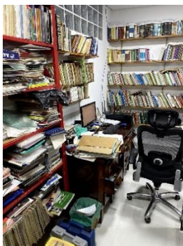
Figura 1 – Escritório

O primeiro deles, é cuidar do espaço que reformamos na casa para ser um espaço multiuso, incluindo o escritório da casa, e que está uma verdadeira bagunça. Agora, só organizar um ambiente, não é, nem de longe, uma matéria de pós-graduação. Então, temos de explicitar melhor algumas das ideias. A primeira é de a partir da organização da “Biblioteca” oferecer aos vizinhos e adjacências o empréstimo gratuito de livros. Na intenção de organizar um mini polo cultural da Vila