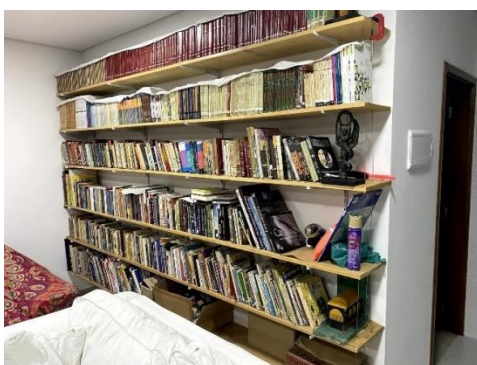
Figura 4 — Escritório