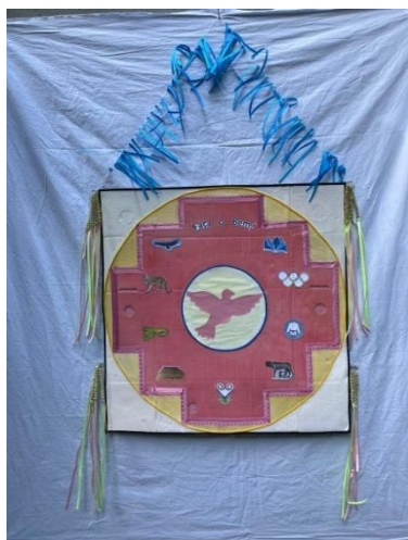
Figura 7 - Bandeira de Marcos

Aconteceram muitas coisas no Curso. Aulas prá lá de interessantes. História, da Carroça e seus integrantes, cada um com um olhar da multifacetada produção do grupo; e, História do Brasil, com situações e personagens que nunca tínhamos ouvido falar, Arte, e até Culinária.