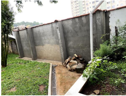
Figura 6 – Quintal

Retomei a leitura da “Pedra do Reino”: cumprindo a missão que eu tinha me dado. Devagar ... algumas páginas por dia.