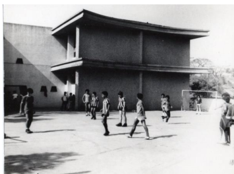
Figura 17 – Escola João Ramos 1980