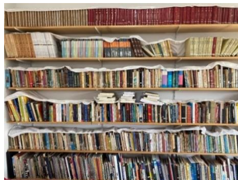
Figura 24 - Livros

“cada um dos grupos em cujo seio vivo e trabalho”, como disse o Ivan Ilich.