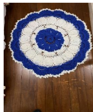
Figura 20 – Arte de Edilene fica mais firme do que o outro.

Eu até tentei aprender, mas não passei da primeira lição: fazer uma carreirinha. Além de torto, um pedaço