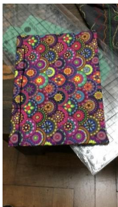
Figura 11 - Caderno de Luísa