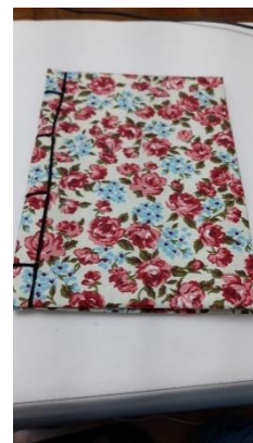
Figura 12 - Caderno de Edilene