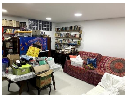
Figura 5 – Escritório