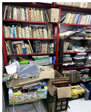
Figura 2 – Escritório