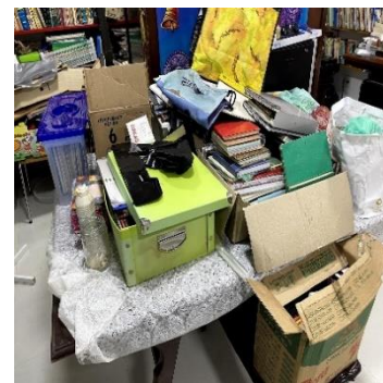
Figura 3 – Escritório