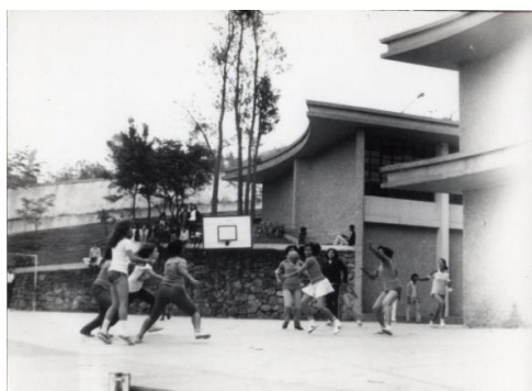
Figura 16 - Escola João Ramos 1980

E, se no geral sinto que não fiz muita diferença, tive alguns momentos de invencionice pedagógica que ficaram mais vivos na memória.