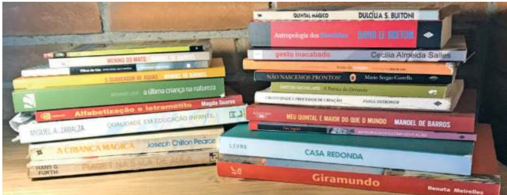
Livros lidos durante o processo de limpeza.