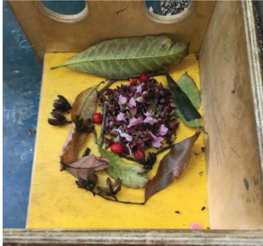
Enfeites circulares. Detalhe da flor rosa no meio de tantas amarelas ( foto esquerda) e das folhas de abacate que dão limite as pequenas flores centrais ( foto da direita).