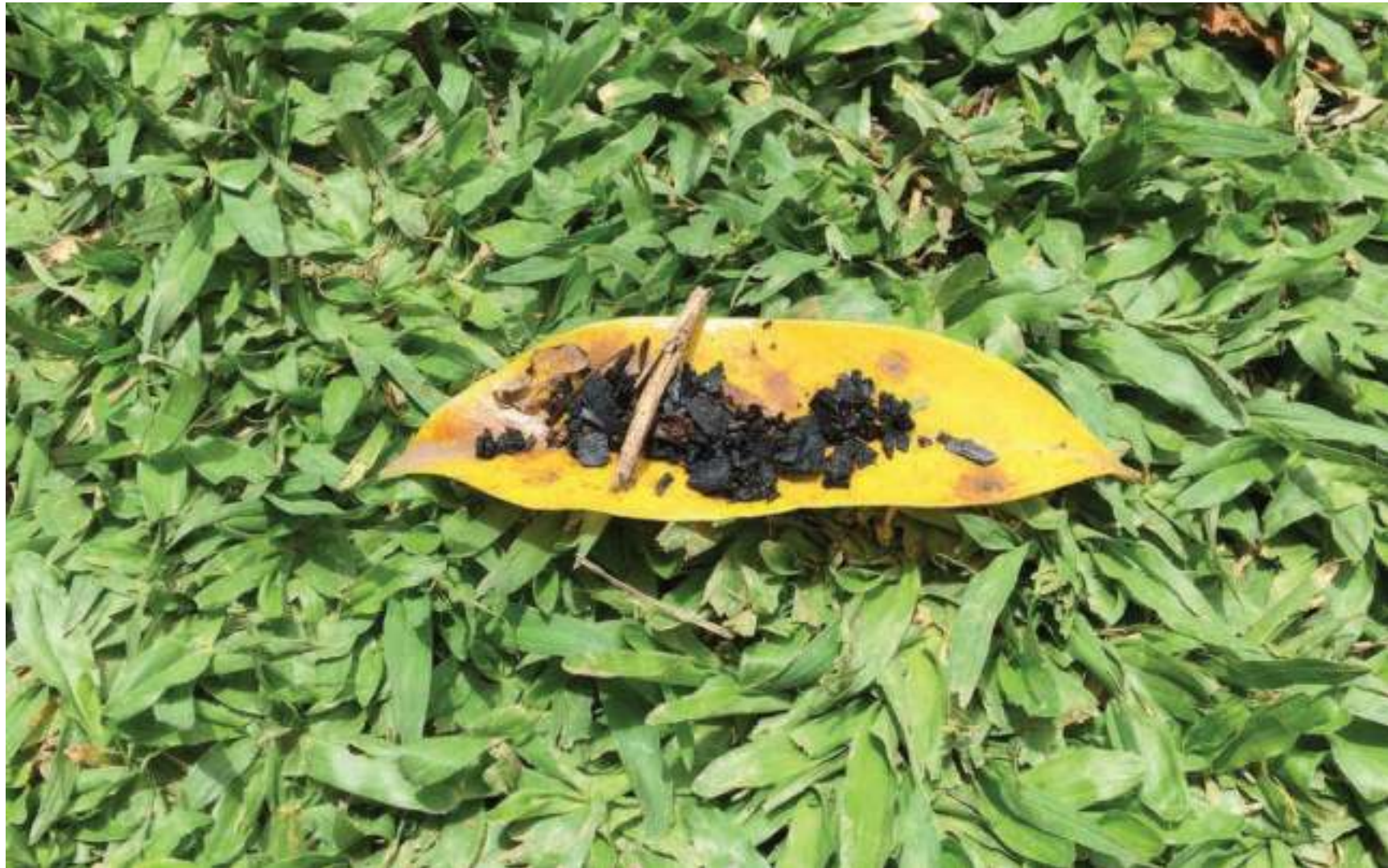
Folha de ouro com pedras preciosas.