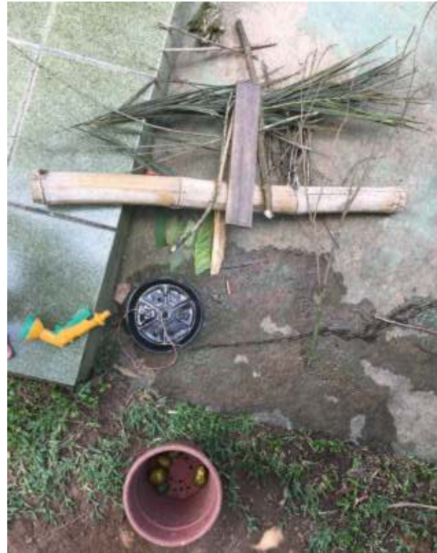
Restos de enfeites e construções feitas por Gaia.

Aqui, penso um pouco à respeito dos valores e os comportamentos que trago comigo, onde o produto final deve ser mostrado, valorizado, fotografado, exposto.... (ainda mais se pensarmos em escola). No caso, de Gaia, as maravilhas produzidas (aqui mãe falando) não são para sempre, são momentâneas e quando o processo termina a importância do enfeite terminou também.