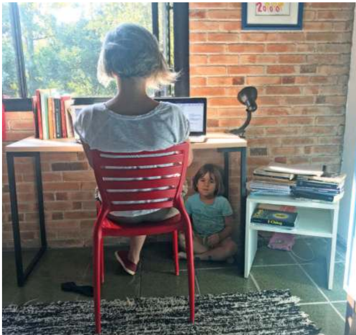
Momento de escrita e de espera.