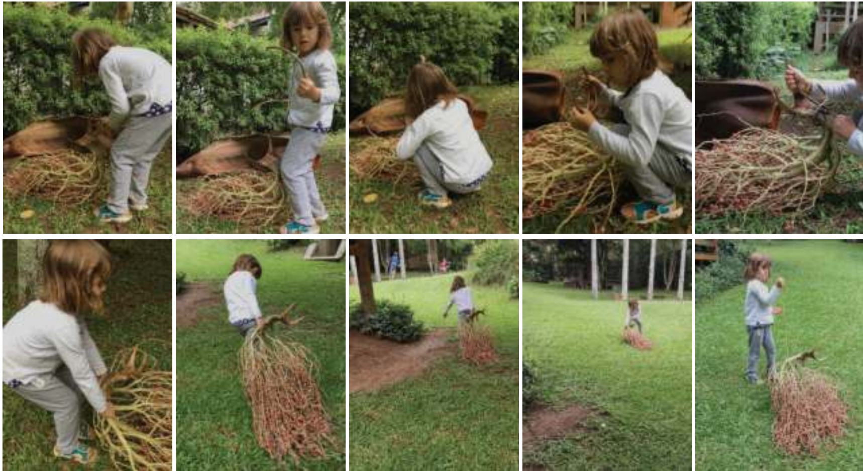
Gaia usa seu corpo e sua força para conseguir arrastar um pesado galho de coquinhos no jardim da minha tia, faz tudo sem pedir ajuda.