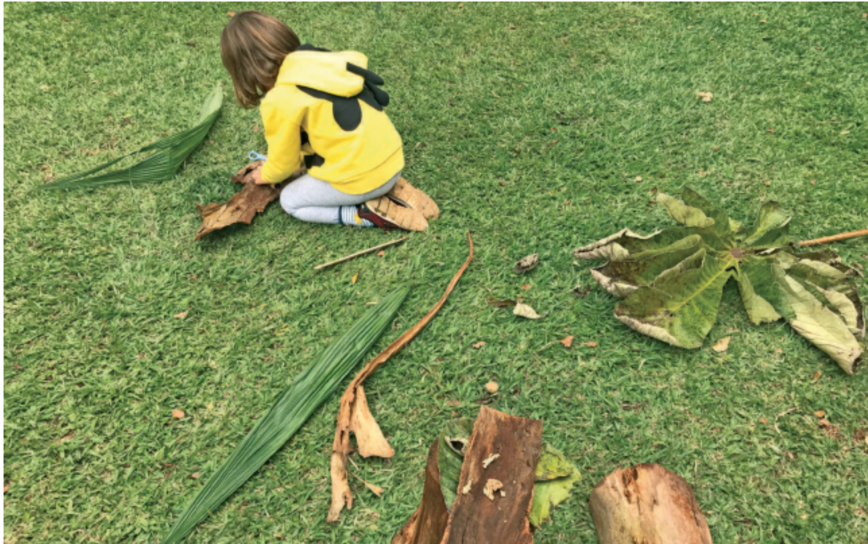
Gaia fazendo uma grande construção no jardim com troncos e cascas de árvores e uma grande folha da embaúba. Quando terminou ela me contou que era um restaurante para os cachorros.