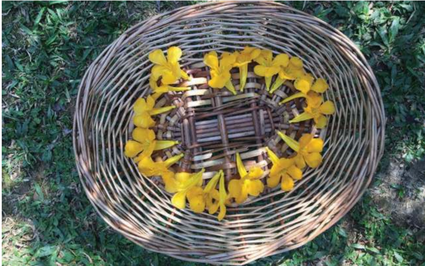
Flores amarelas de ipê enfeitando um cesto de palha.