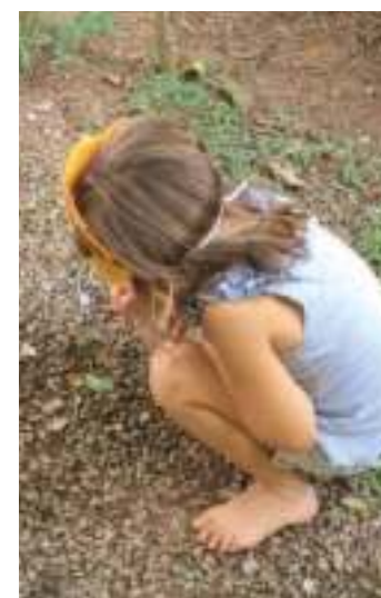
Sua posição preferida: cócoras.