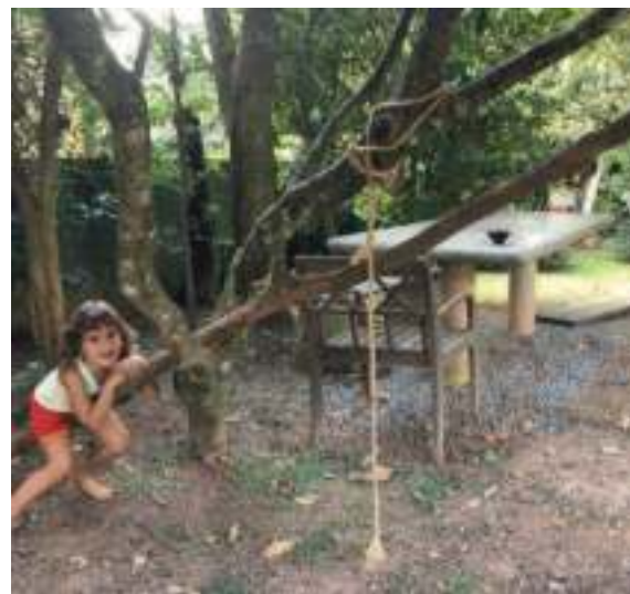
Gaia tentando abaixar o pesado galho para se sentar nele, depois de ter atravessado-o.