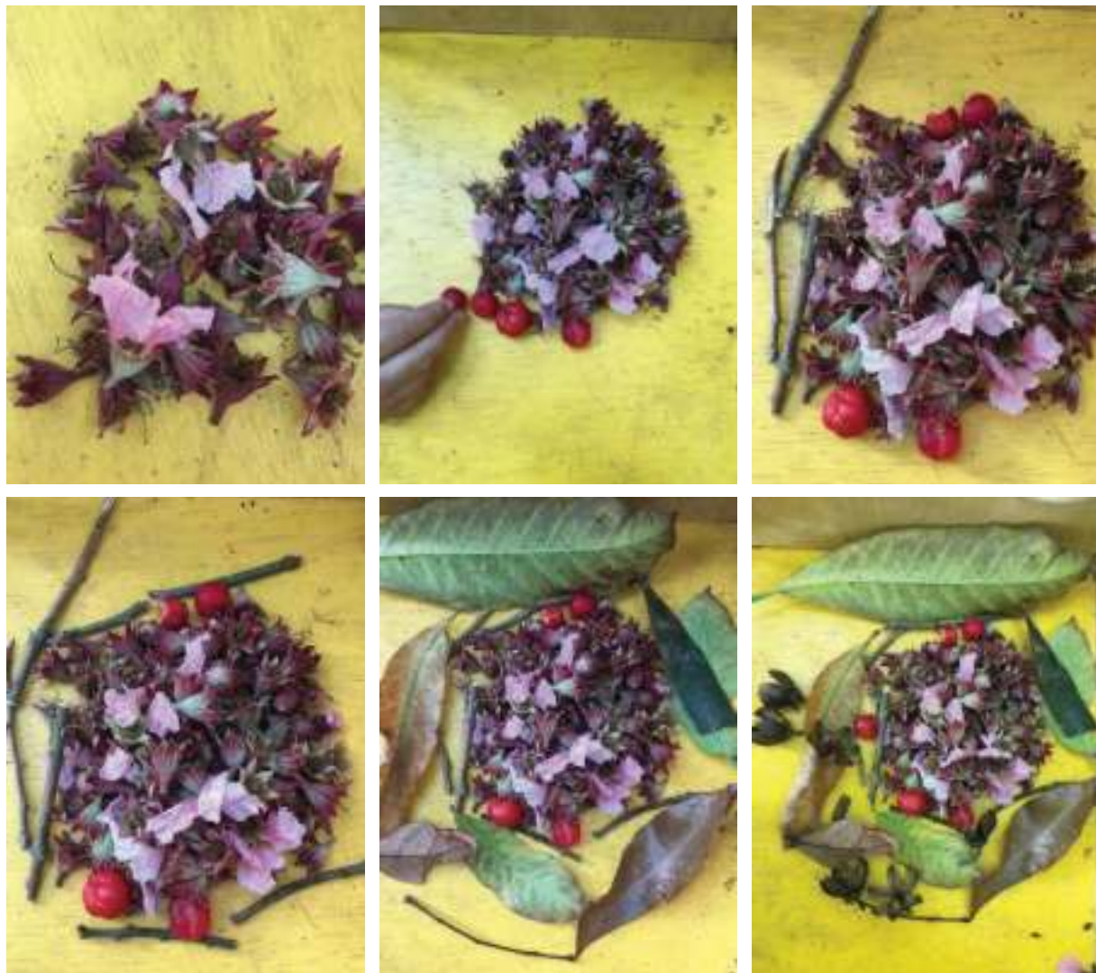
Nesta sequência de fotos, as etapas na construção de um enfeite.