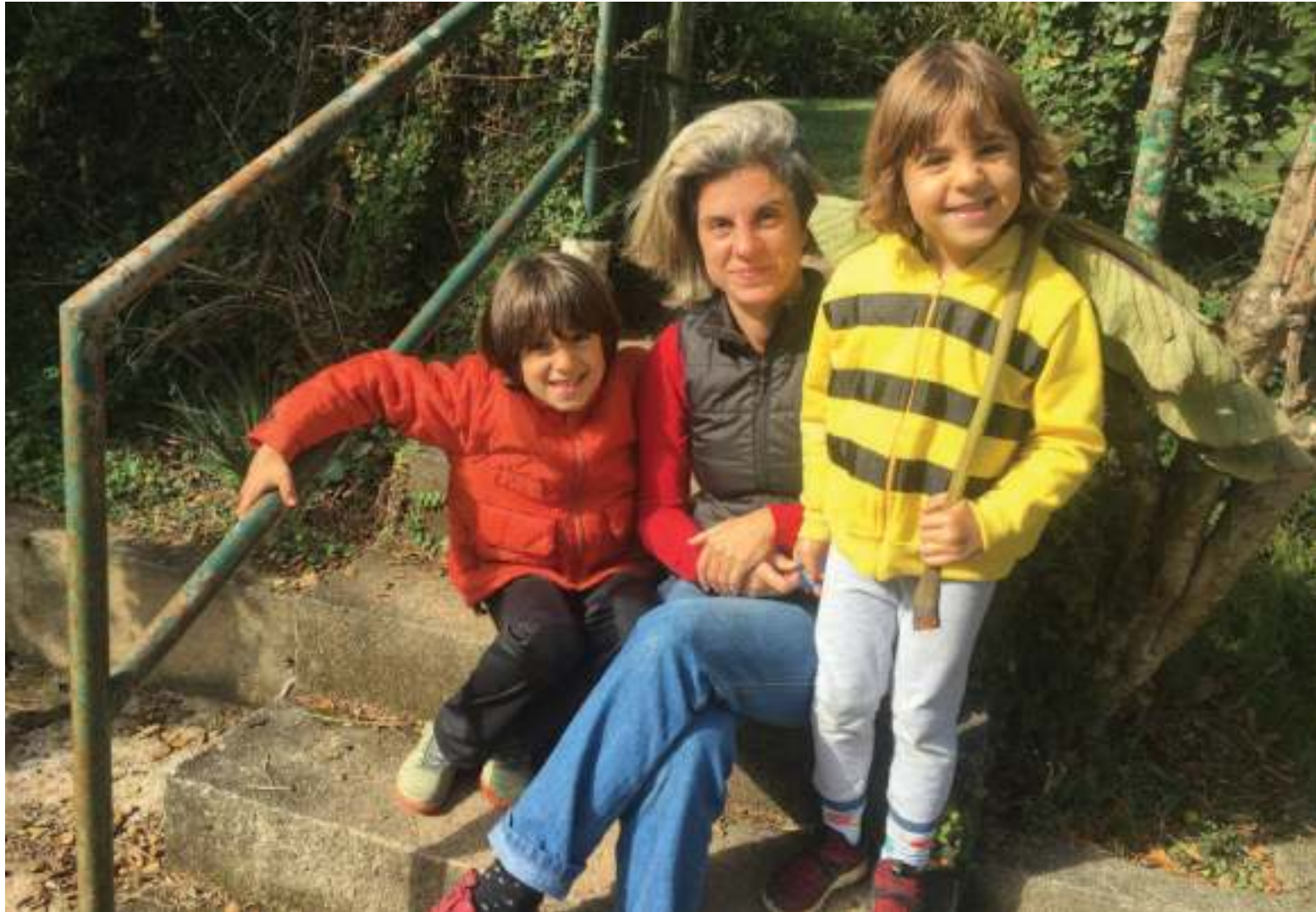
Eu e meus filhos na escada que dá acesso ao jardim da minha mãe.