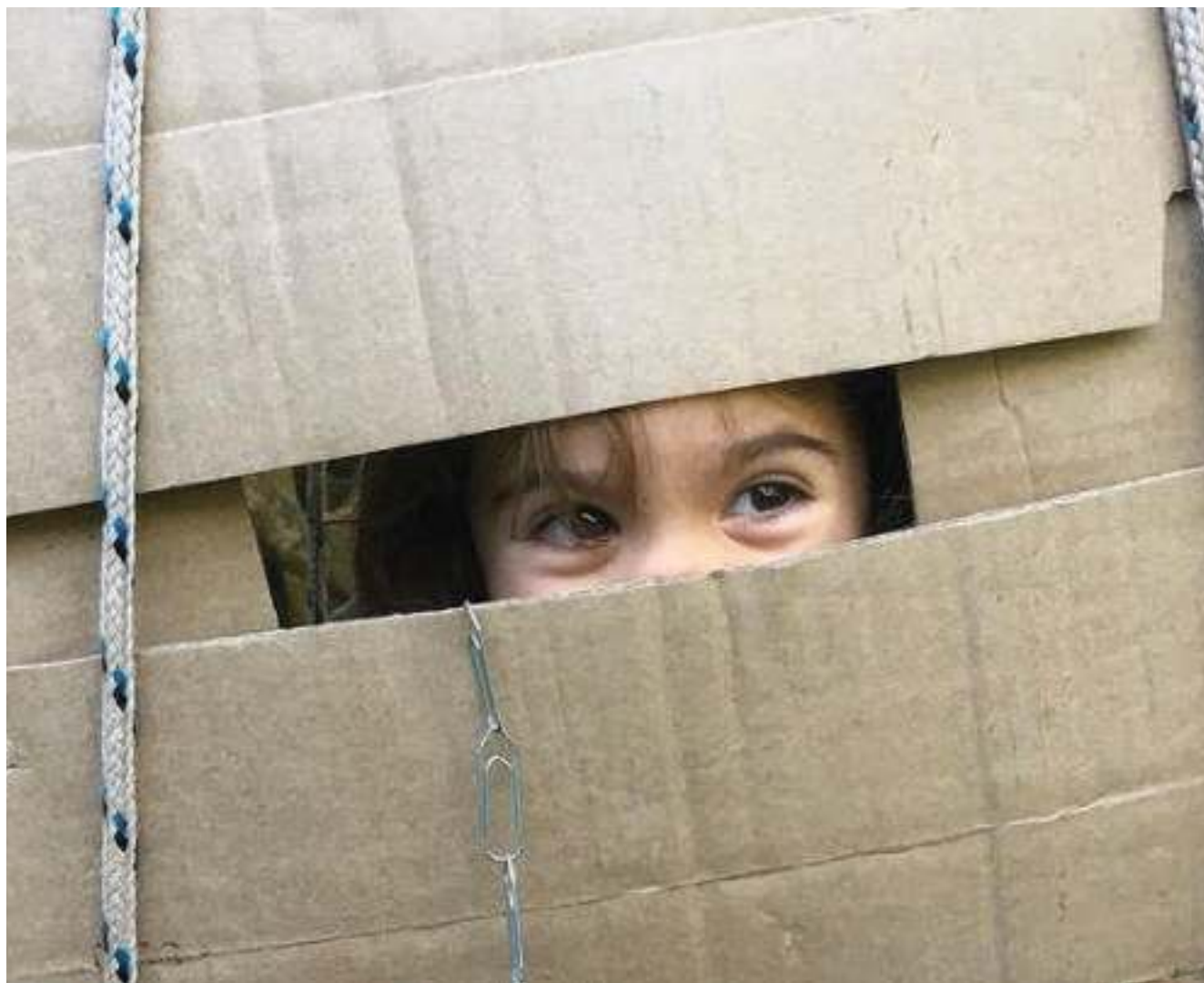
Se escondendo do "colona vilus".

Espaço que comporta movimento e experimentos do corpo, espaço que mostra a vida e as transformações na natureza, espaço que possibilita estar sozinho e com muitas pessoas.