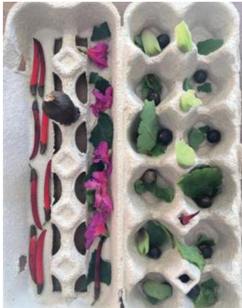
Enfeite feito durante um longo processo de entrega. Eu, particularmente, acho absolutamente harmonico e delicado pelos elementos escolhidos e a forma como ela organizou-os.

Às vezes a busca pelos elementos demanda andar pelo jardim e conforme encontra algo que lhe interessa já começa a esboçar uma cria-