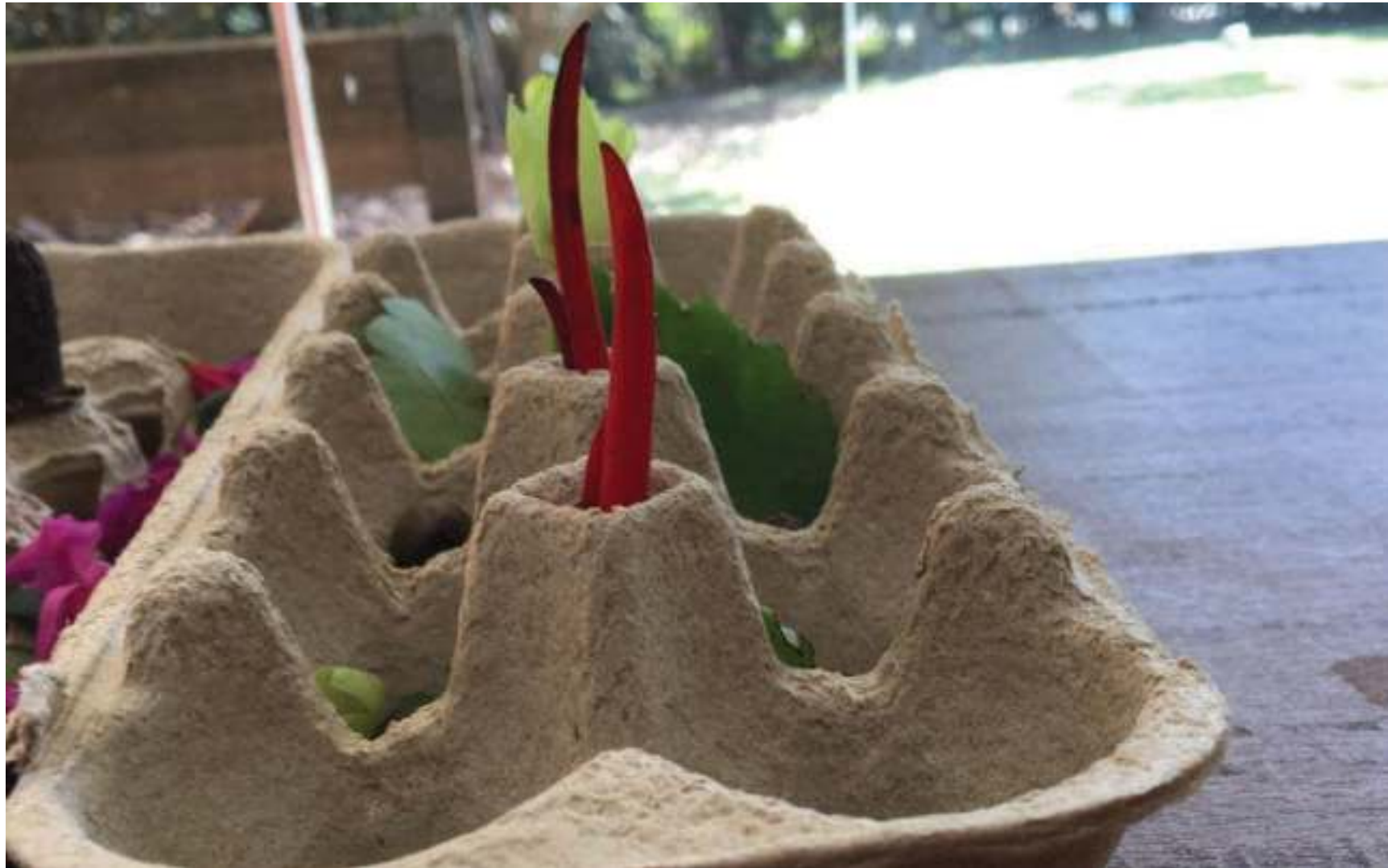
Com os mesmos elementos de um enfeite já pronto, ela desmonta para montar outro. Desta vez encaixa de pé as flores vermelhas do mulungu.