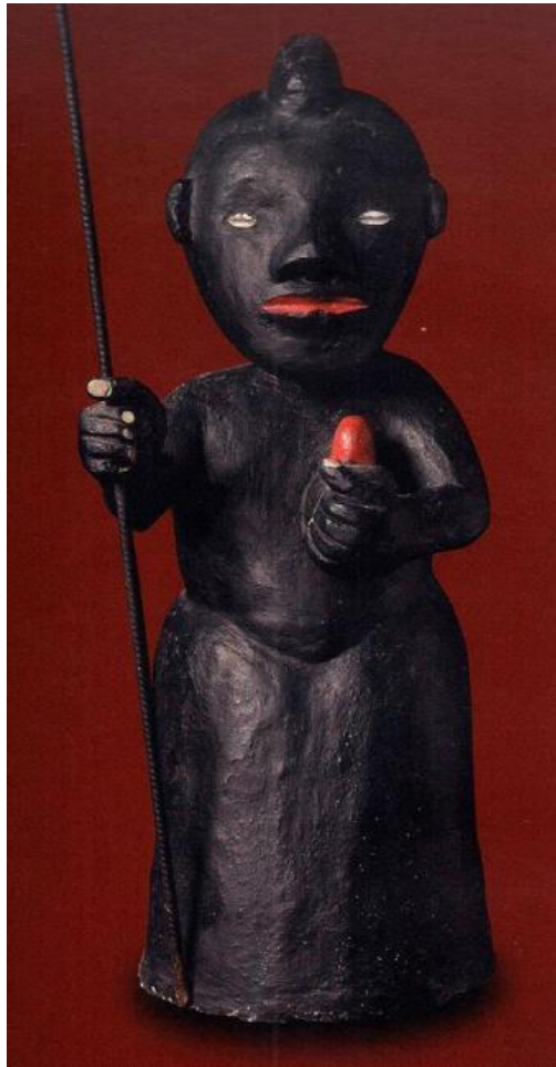
Figura 3 – Exu Amuniwa – Orisa Exu com sua cabeça 8

ao cristianismo que condenou a sexualidade ao pecado e escondeu a carne como o próprio símbolo da natureza pecaminosa da humanidade. Mas Exu é o orixá gerador, é a força motriz da reprodução dos seres e do conhecimento. É a divindade mensageira e instrutora. A incompreensão dualista de uma cultura cristã não pode entender, senão como ameaça, a dimensão simbólica do ogó .