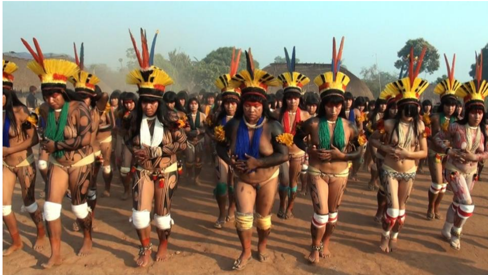
Figura 4 – Cena do filme As hiper mulheres , de Carlos Fausto, Leonardo Sette e Takumã Kuikuro, que nos conduz num mergulho delicioso na tradição dos cantos femininos e nas brincadeiras indígenas que aludem à uma "guerra sexual" na festa do ritual feminino Jamurikumalu.