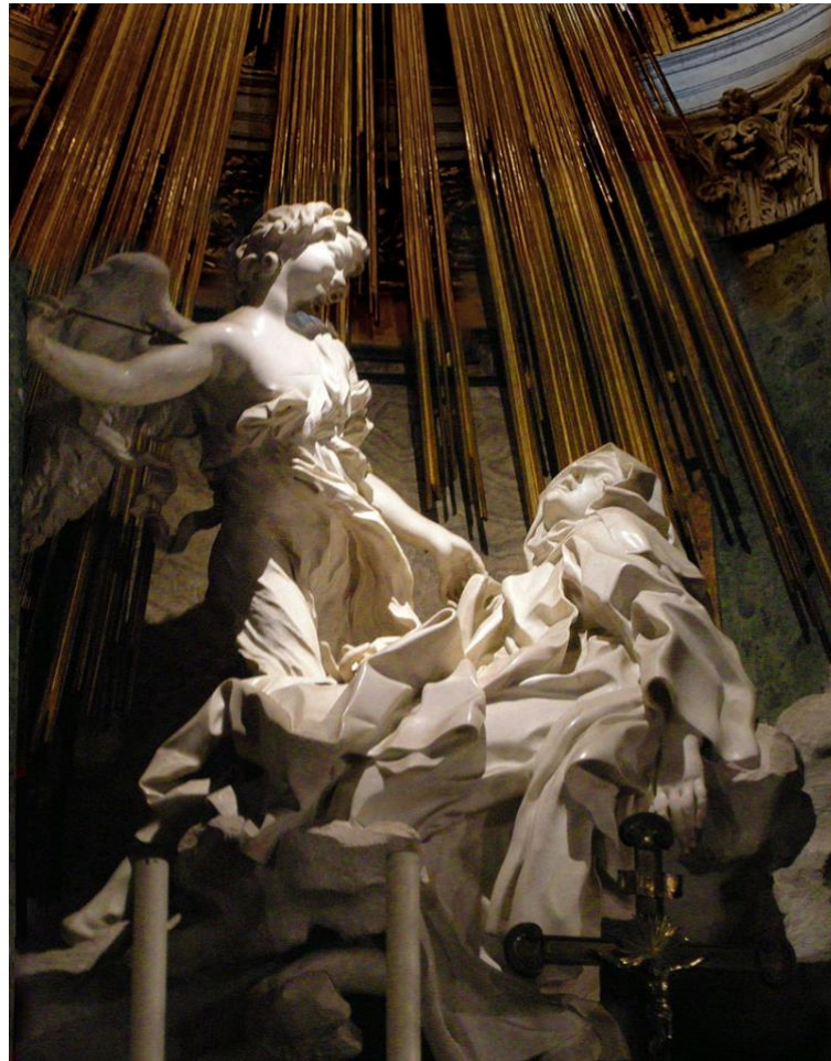
Figura 1 – Bernini e o Êxtase de Santa Teresa 4 , 1647-1652

Fonte: Wikipedia. Em: Santa Maria della Vittoria. Disponível em: < https://pt.wikipedia.org/wiki/Santa_Maria_della_Vittoria#/media/Ficheiro:Bernini_-_Santa_Teresa_em_extase.jpg >. Acesso em: 21 de fevereiro de 2021