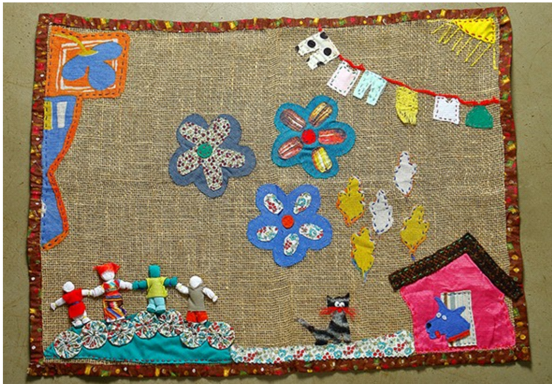
O Quintal da Casa da Vila

Depois da peça pronta, surgiu um último detalhe, muito particular: a narrativa escrita. Num bolsinho atrás da arpillera, depositamos um pequeno texto escrito com a história da representação do nosso trabalho. Percebi que a costura foi o recurso principal para pensar, narrar, escutar, escrever.