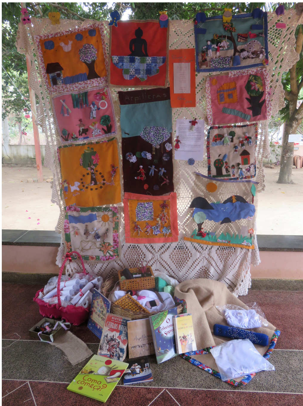
Exposição coletiva dos trabalhos do grupo

Oficina de artes manuais e histórias de si: duração de 12 horas, em setembro, outubro e novembro de 2016. Parceria com o SESC Itaquera, São Paulo, S/P. A oficina foi desmembrada em três manhãs. Trabalhei com o coletivo de catadores Zona Leste Faz!