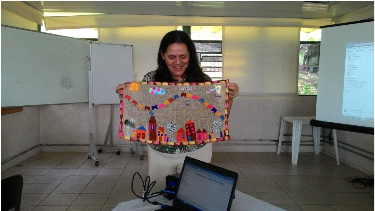
Arpillera representando uma cena urbana

Oficina de artes manuais e histórias de si: duração de 12 horas, em janeiro de 2017. Parceria com a Casa Colaborativa Mater Luna, Salvador, Bahia. O grupo era formado por terapeutas, educadoras, ativistas sociais, uma secretária e um designer gráfico.