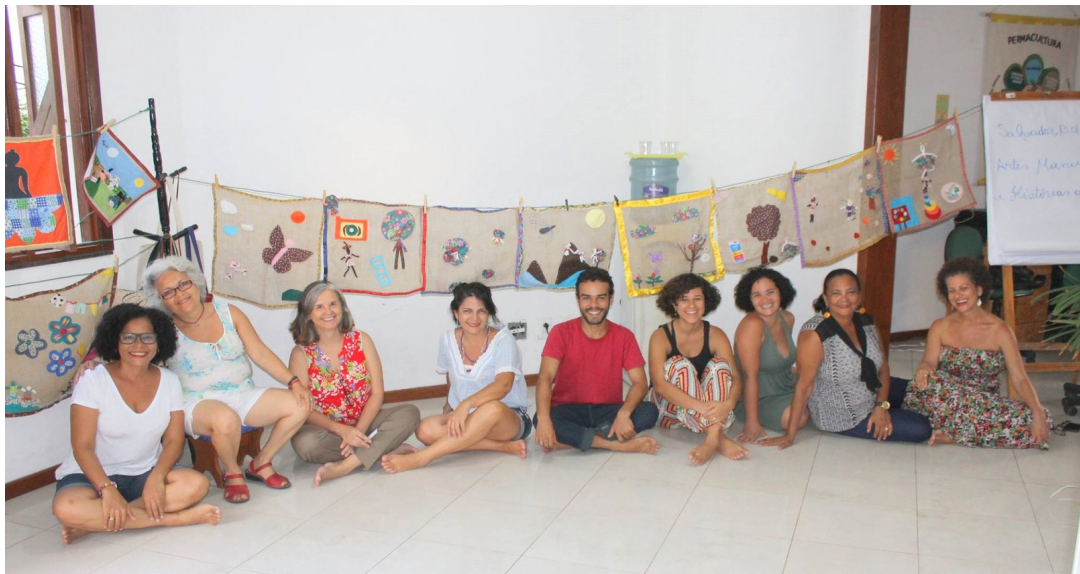
Exposição dos os trabalhos do grupo

Oficina de artes manuais e histórias de si: duração de 12 horas, em janeiro de 2017. Parceria com a Casa Colaborativa Mater Luna, Salvador, Bahia. O grupo era formado por terapeutas, educadoras, ativistas sociais, uma secretária e um designer gráfico.