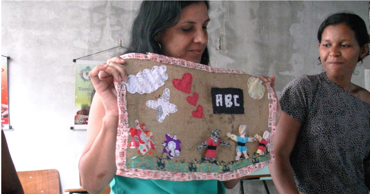
Arpillera da professora, que representou uma cena com seus alunos na escola

Oficina de Arpilleras – artes manuais e histórias de vida: duração de 12 horas, em dezembro de 2015. Em parceria com a ONG A Casa dos Sonhos, bairro Santa Rita, periferia de João Pessoa, Paraíba. O grupo era feito de mulheres educadoras, assistentes sociais e uma cozinheira.