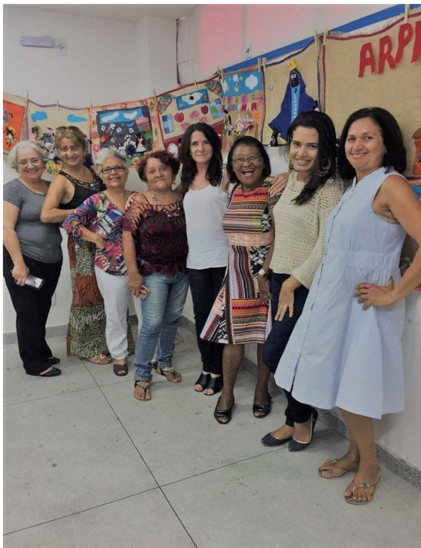
Exposição coletiva dos os trabalhos do grupo

Centro Cultural Mangabeira. O grupo era formado por mulheres acima de 60 anos, com exceção de uma menina de 12 anos que acompanhava a avó.